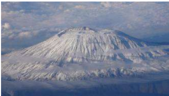
Карточка 1: 1) Нагорье Тибести