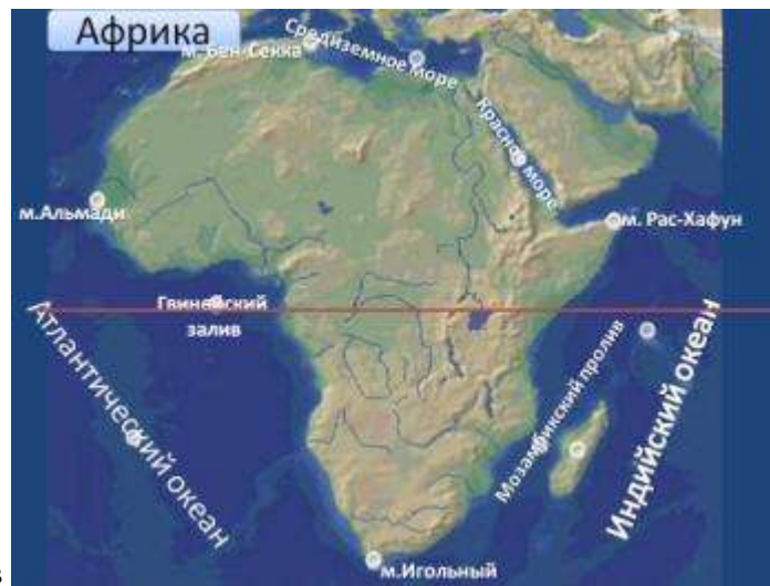
2) Гвинейский залив