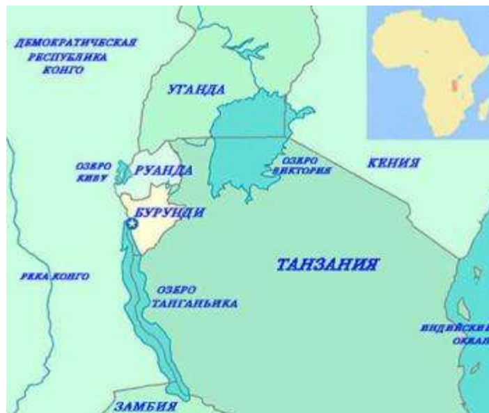
3) озеро Танганьика