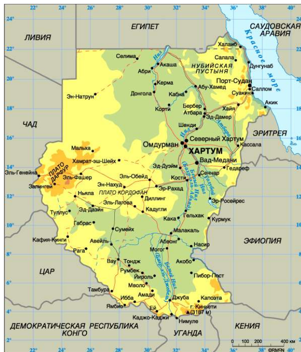
4) плато Дарфур