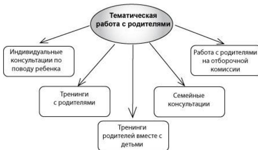
Рис. 2. Тематическая работа с родителями

Тематическая работа с родителями. Основные направления тематической работы с родителями схематически изображены на рисунке 2.