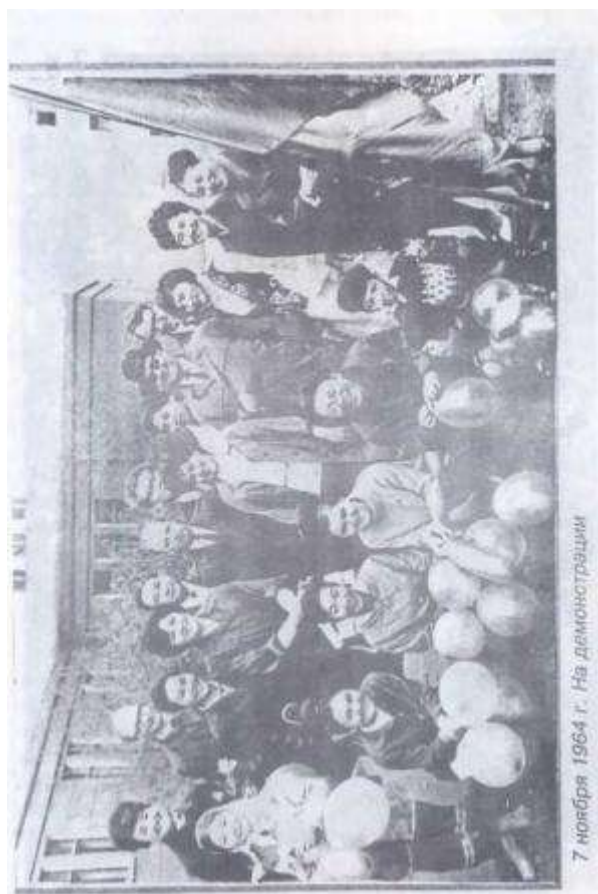
7 ноември 1964 г. На демонстрация